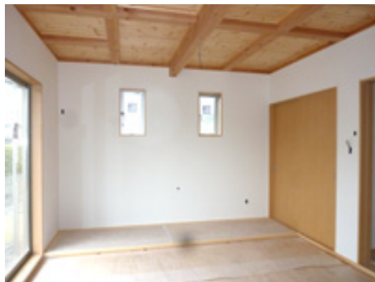
ダイニングからリビングを見る