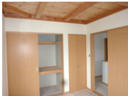
子供室 収納部を見る