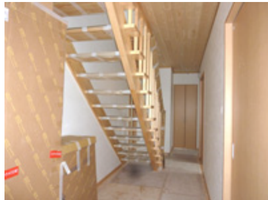
玄関ホールから廊下を見る