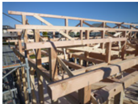
平屋建ての上棟時の様子