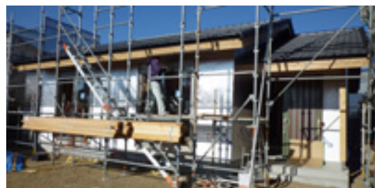
外断熱工法で遮熱材を施工した様子

～2階建て 在来軸組工法 延床面積 32.01坪 延施工面積 35.16坪～ ＜若夫婦の子育て住まい＞