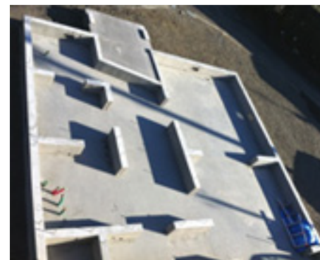
基礎工事を上から見た様子

現場の方は昨年は29日まで仕事を進め、屋根の防水のためのアスファルトルーフィングを施工後、洋形瓦を屋根に上げて終了しました。今年は外壁下地の面材の施工から始めて、ベランダの下地、防水工事へと進んでいきます。