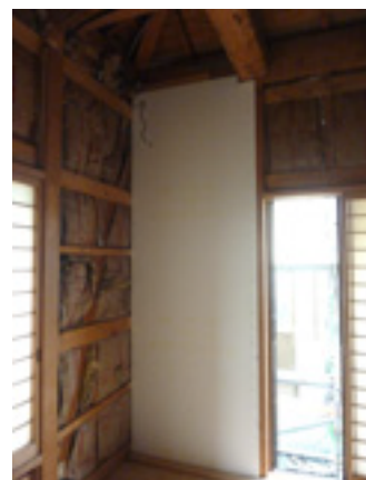
和室の耐力壁の増強

仕事としては難しいものではないのですが、施工するにあたっては空間が狭いとやりにくい所もありまして、工夫が必要でした。