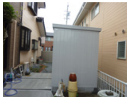
物置+土間コンクリート