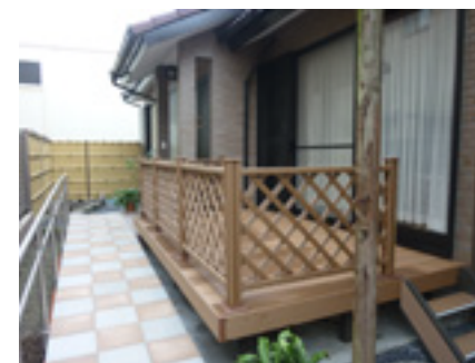
アプローチとデッキ